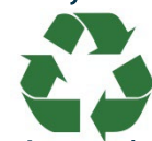
Anneau de Möbius