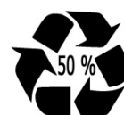
Anneau de Möbius